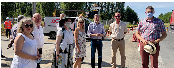
Travaux de sécurisation du carrefour de la RD347 - RD36 à Verrue