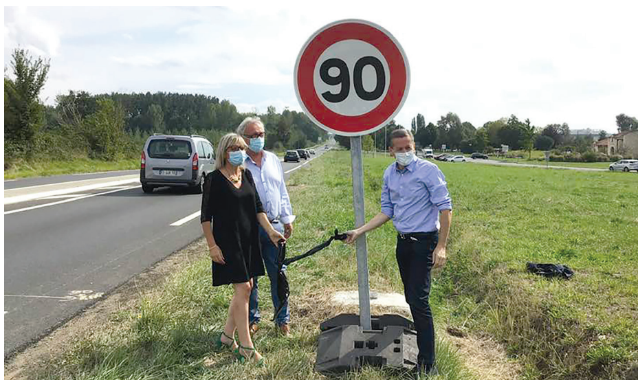
Retour aux 90 km/h dans le Département de la Vienne

Sur notre canton, ce sont notamment les routes départementales D61 (Loudun-Indre et Loire) et la D347 (Loudun-Poitiers) qui sont de nouveau à 90 km/h.