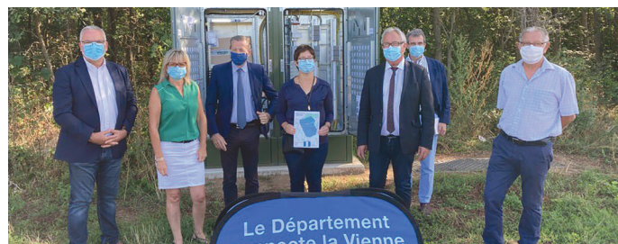
Inauguration des Montées en Débit à La Chaussée, Saint-Clair et Berthegon, fin août