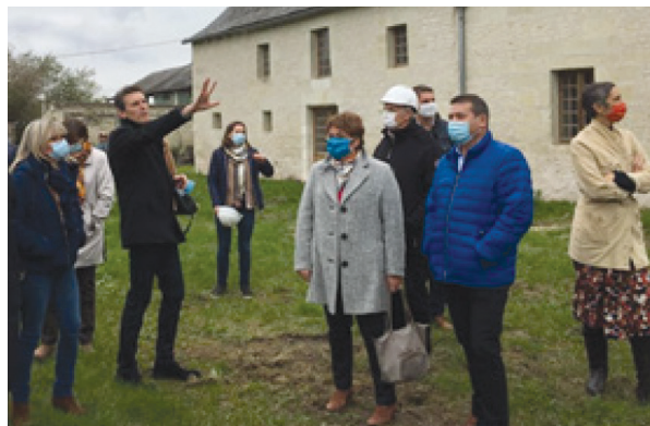
Conférence de presse lors du lancement des travaux de l'Historial du Poitou le 15 octobre 2020

Ce nouveau site touristique majeur pour l'attractivité du département et le rayonnement de l'Histoire de France en Poitou ouvrira ses portes à Monts-sur-Guesnes en avril 2022.