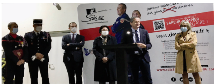
Inauguration de la nouvelle caserne des pompiers de la Blaiserie, le 8 octobre