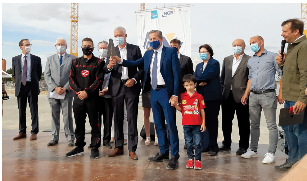
Pose de la première pierre de l'Arena Futuroscope le 26 août 2020