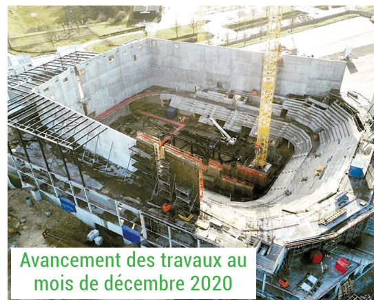
Avancement des travaux au mois de décembre 2020

L'Arena Futuroscope est également d'ores et déjà labellisé Paris 2024 !