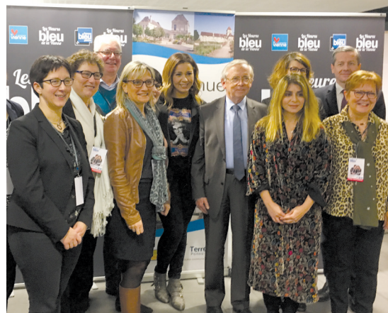
Concert des Heures Bleu à Lençloître avec Julie Zenatti et Chimène Badi

Le prochain concert aura lieu à Châtellerault (l'Angelarde) le 24 octobre 2019. Celui du 6 février 2020 est d'ores et déjà programmé à Loudun.