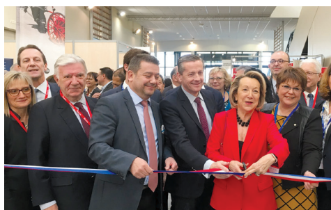
Inauguration officielle du Salon des Maires de la Vienne