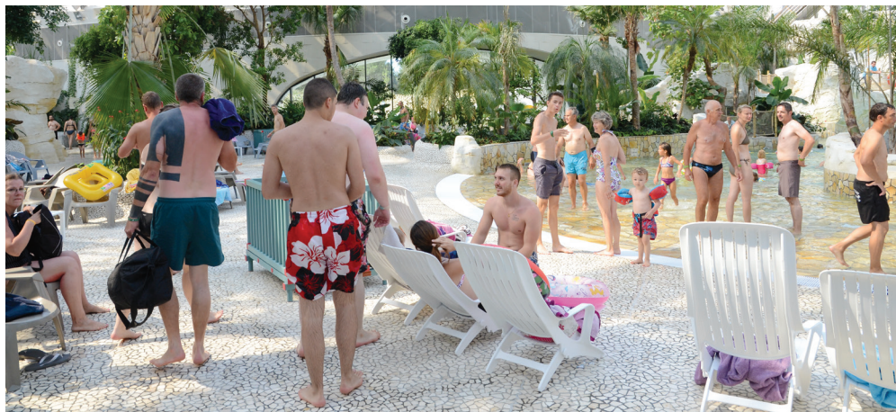
Aqua Mundo - Le Bois aux Daims

Ouvert en juillet 2015, le Center Parcs du Bois aux Daims faisait le pari, au-delà d'être un succès économique , de générer de l'activité sur le territoire.