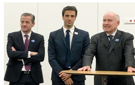
Avec Tony ESTANGUET, Président de Paris 2024, et Dominique BUSSEREAU, Président de l'Assemblée des Départements de France

En septembre 2017, Paris était officiellement désignée ville hôte des Jeux Olympiques et Paralympiques (JOP) 2024 . À cette occasion, Bruno BELIN est devenu référent de l'Assemblée des Départements de France auprès des instances organisatrices des Jeux. Il a réaffirmé la volonté des Départements de s'engager pour la réussite des Jeux. A titre d'exemple, 600 centres de préparation labellisés seront sélectionnés dans les départements par le Comité International Olympique. Les jeunes et les bénéficiaires du RSA pourront alors devenir l'un des 70 000 futurs volontaires des JOP ou bien des partenaires actifs. Le club « La Vienne en Jeux » a été créé pour mobiliser le plus grand nombre et proposer des manifestations dans le département.