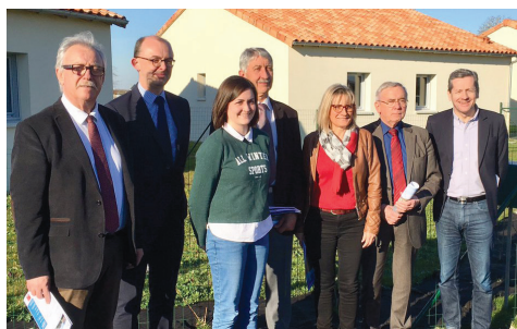
Inauguration des nouveaux logements Habitat de la Vienne à La Roche-Rigault