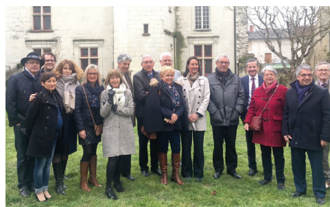
Rencontre avec les Historicals de France à Monts-sur-Guesnes