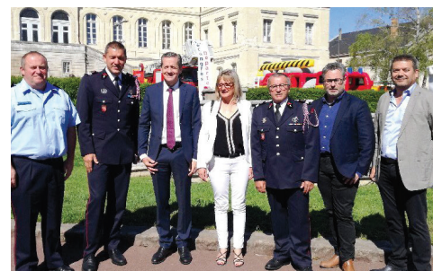
Au Congrès départemental des Sapeurs-pompiers de la Vienne à Loudun