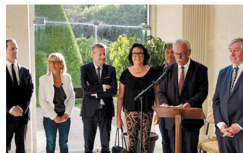
Hommage à René MONORY à Loudun pour son 96 e anniversaire