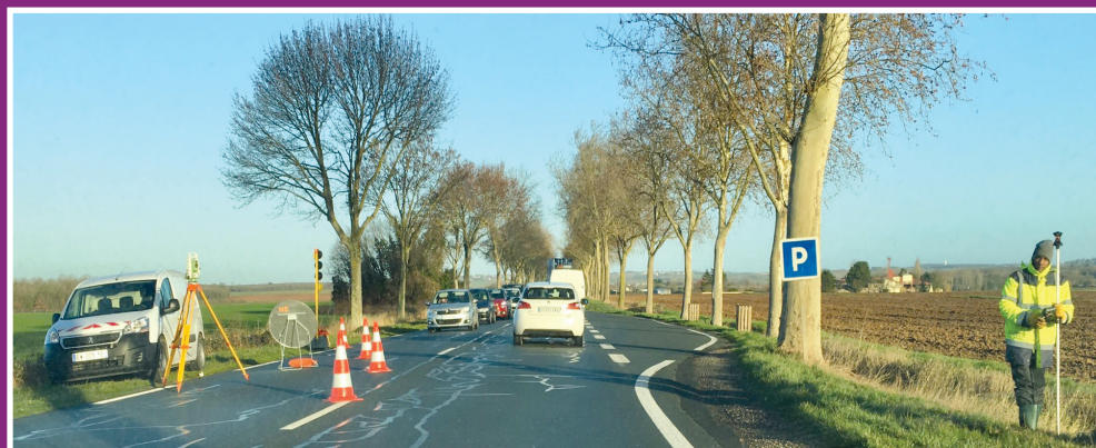
Les travaux de la RD347

Le début des travaux est programmé en 2021 pour une mise en service en 2023 au plus tard.