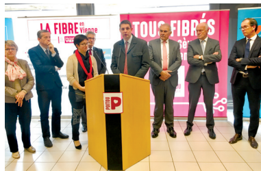
Lancement de la fibre à St-Georges-lès-Baillargeaux

Le 10 avril dernier, les Départements de la Vienne et des Deux-Sèvres se sont réunis pour le lancement officiel du chantier de la fibre optique pour tous.