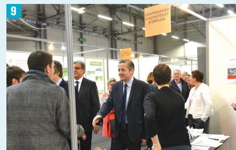
Schéma de l'Autonomie 2015-2019 : il concerne à la fois les personnes âgées et handicapées autour des problématiques communes liées à l'autonomie, notamment le vieillissement, le soutien aux aidants et le logement.

Mobilisation pour le retour à l'emploi des bénéficiaires du RSA : solidaire, le Département est l'échelon de proximité qui soutient les populations fragiles en concentrant ses efforts d'insertion sociale et professionnelle.