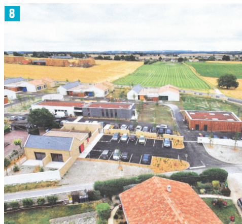
Schéma Enfance Famille 2015-2019 : c'est un outil de cohésion sociale qui a pour objectif d'améliorer les réponses aux familles, aux enfants et aux jeunes en difficulté.

En 2016, le Département a inauguré les lieux de vie de Bournand et le Village d'Enfants de Monts-sur-Guesnes.